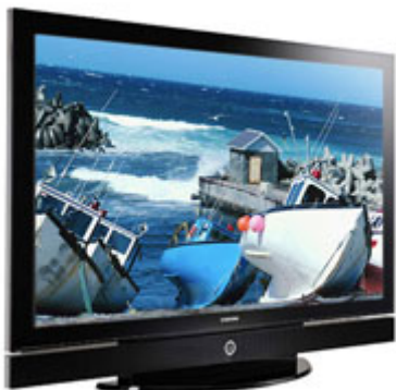
PS63P5HX 63" (160cm) Plazma televízió Bruttó 1 979 900.-Ft

TELEVÍZIÓK * KAMERÁK * DVD LEJÁTSZÓK * AUDIÓ RENDSZEREK