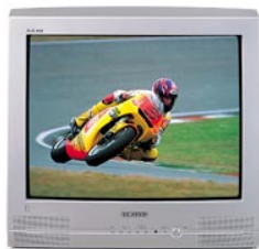
A legkedvezőbb árú televízió (A készlet erejéig!) CZ-21F32T 21"-os (55 cm) Bruttó 38 400.-